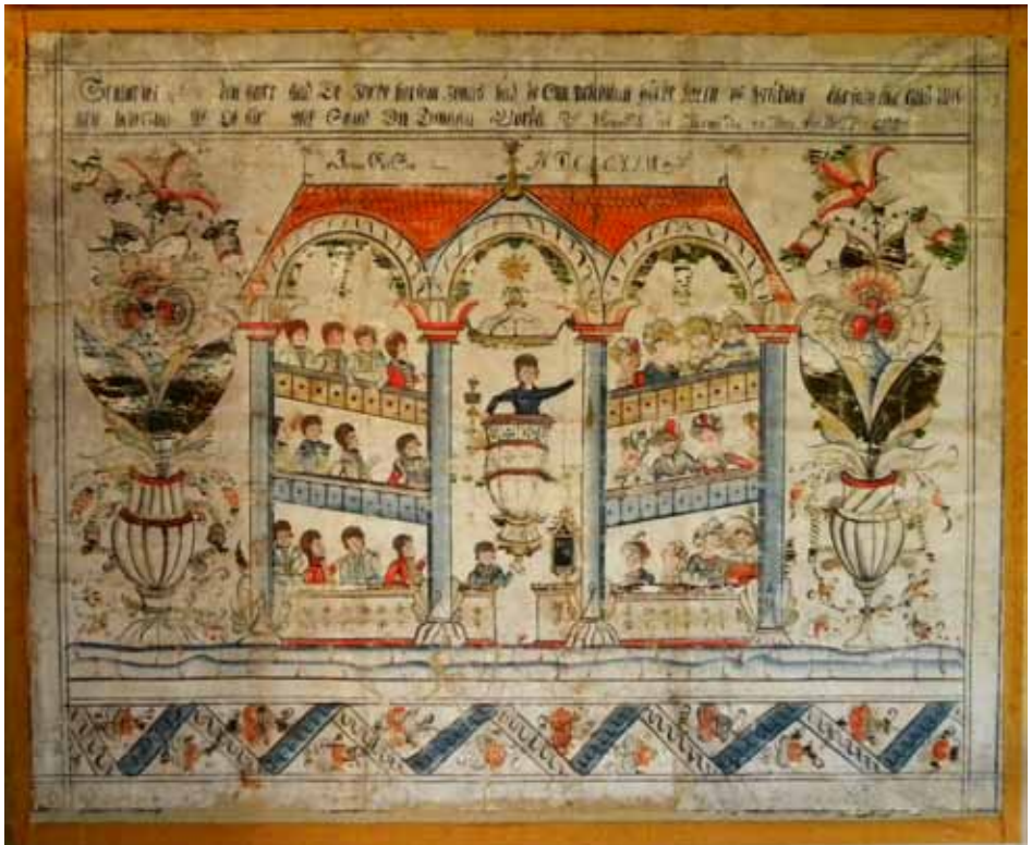
Den här stilen på tavla hade mormor och morfar. Jag har en tavla med mitt namn och födelseatum.35

Jag kommer från grannlandskapet Hälsingland, men både hemma hos oss och mormor och morfar fanns kurbitstavlor, en har jag med mig.