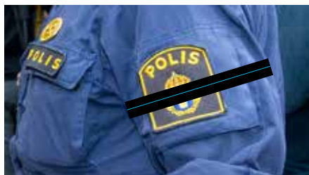
Bilden är ett montage.

Creative Commons Attribution-Share Alike 4.0 International