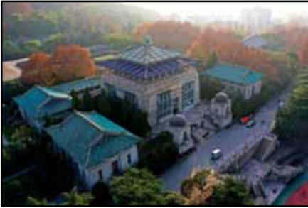
Universitetet i Wuhan hade när pandemin bröt ut även flera svenska studenter.

Huvudstad i provinsen Hubei i centrala Kina. Staden hade drygt 11 miljoner invånare 2018 och ligger där Yangtzefloden förenas med sin största biflod Han Shui.