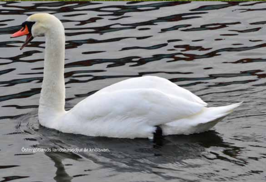
Östergötlands landskapsdjur är knölsvan.