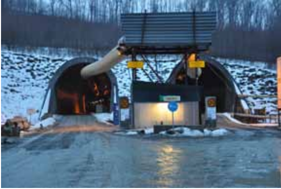
Hallandsåstunnelns norra öppning

Ett av grundproblemen var att ingenjörerna skulle samarbetat mer med kunniga geologer. Man påbörjade arbetet med tunneln 1992, men förseningar gjorde att tunnelbygget först kunde färdigställas 20 år senare till en kostnad av 10 miljarder kronor (ursprungligen var tanken att det skulle kosta 900 miljoner kronor och vara klart 1996).