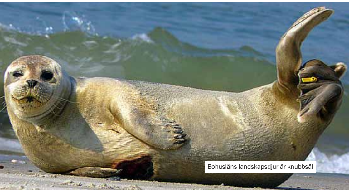
Bohusläns landskapsdjur är knubbsäl