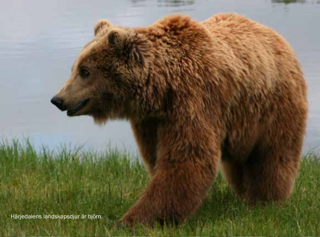
Härjedalens landskapsdjur är björn.