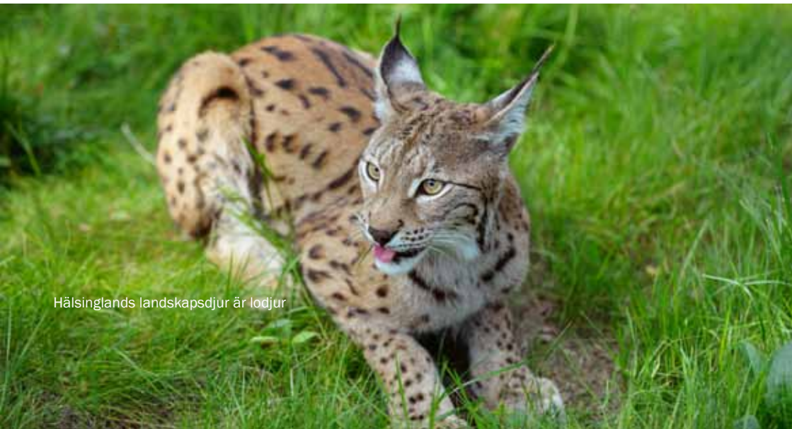
Hälsinglands landskapsdjur är lodjur