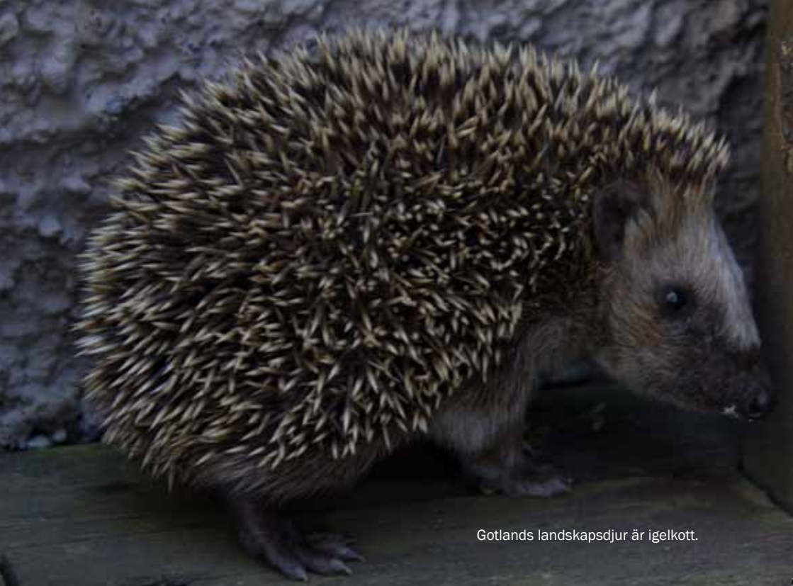
Gotlands landskapsdjur är igelkott.