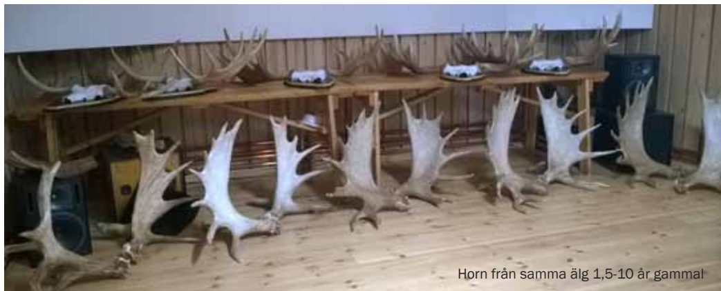
Horn från samma älg 1,5-10 år gammal