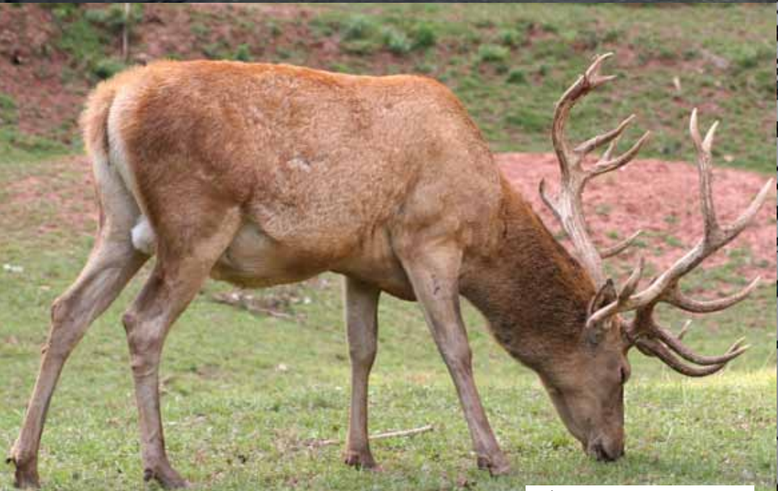
Skånes landskapsdjur är kronhjort.