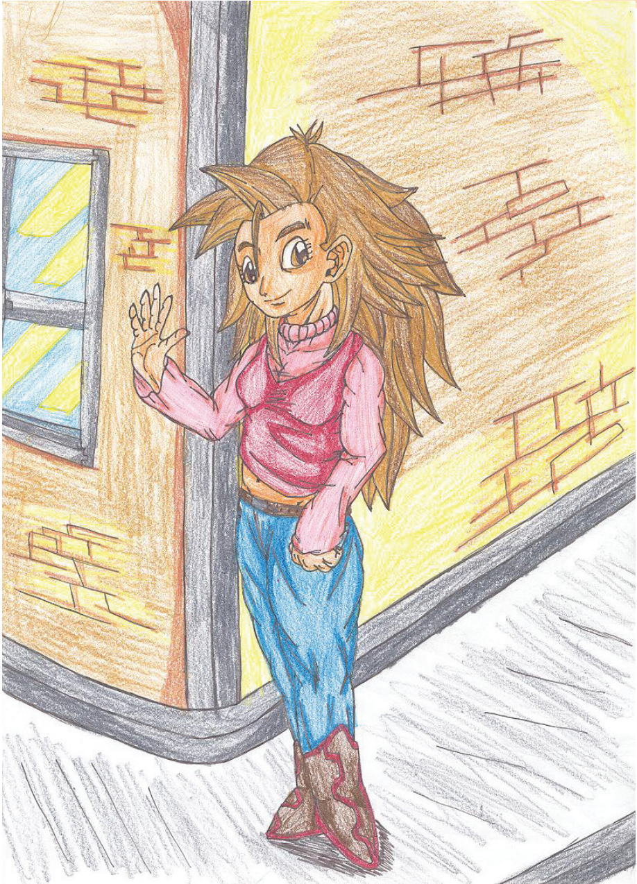
ILLUSTRATION: Daniel Bäckström