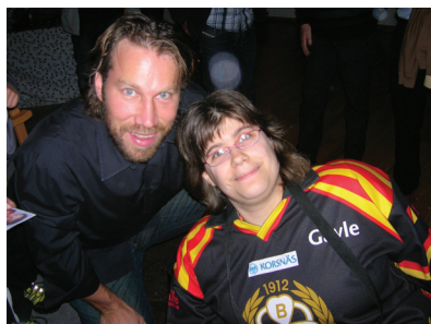
Jag och Foppa i Härnösand 2011

Många MoDo-killar har spelat i NHL; Mattias Öhlund, Daniel och Henrik Sedin, Peter "Foppa" Forsberg och Markus Näslund bl. a. De två sistnämnda växte upp och spelade tillsammans och jobbar nu båda i MoDo Hockeys ledarstab, Markus som General Manager och Peter som assisterande dito.