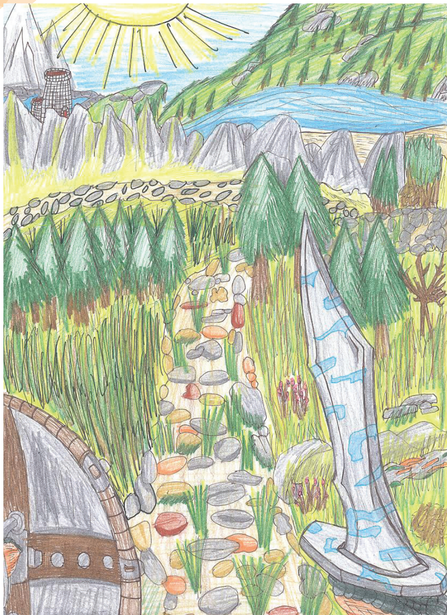
ILLUSTRATION: Daniel Bäckström