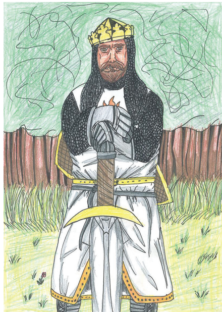
ILLUSTRATION: Daniel Bäckström

"Se alltid på ditt liv som nåt glatt" och sången som på engelska heter "Diva's Lament" (Vad tusan hände med min roll?) – där Damen i sjön beklagar sig över att hon inte fått vara med i andra akten i sin föreställning (det här är i slutet av den).