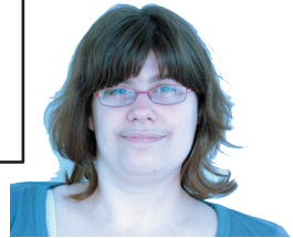
Stina Palm Text, Foto