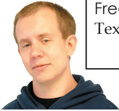
Fredrik Lundmark Text, Foto