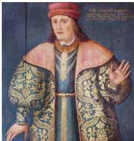
Erik av Pommern

Detta blev inte fallet utan i Sverige valdes Gustav Vasa till kung den 6 juni 1523.