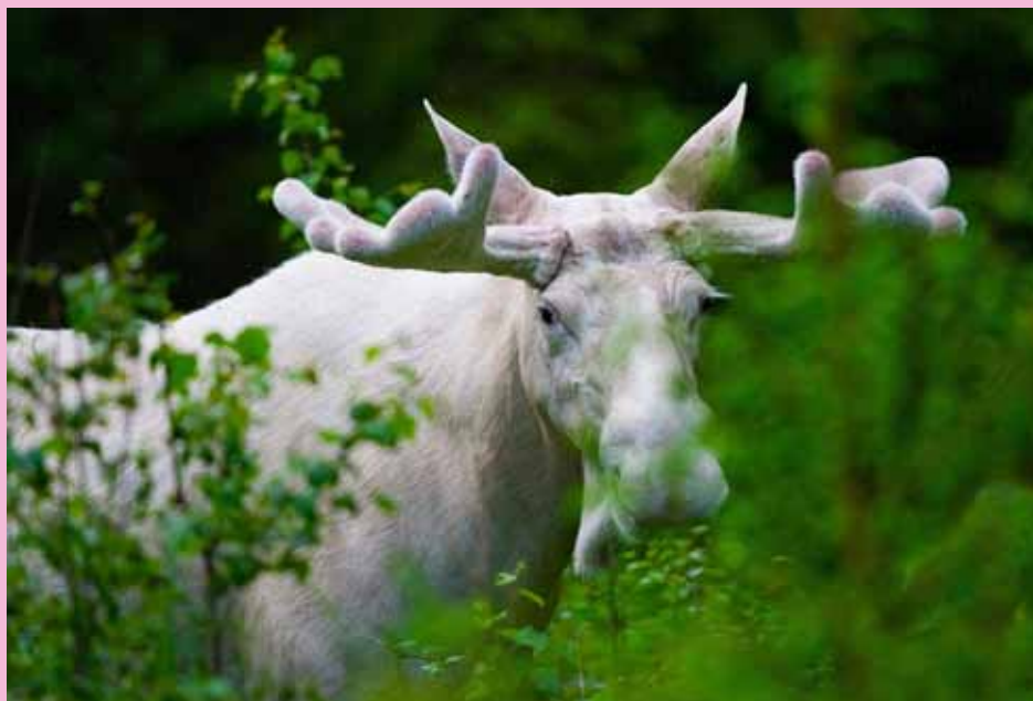
Just den här älgen är inte svensk, så den kan skilja i utseende och storlek.

Av Sveriges 300.000 älgar, är cirka 100 (3,3%) vita. En stor missuppfattning är att den vita älgen är albino. Albinism är ett medfött tillstånd som leder till förlust av pigment och resulterar även i ljusa eller rosa-röda ögon. Detta är inte vad som gäller för våra vita älgar. Vitheten beror istället på ett fenomen som kallas leucism och innebär att älgen kan producera ämnet melanin, men inte lagra det. Leucism är ärftlig och även bruna älgar kan bära på genen. Det betyder att en vit älgko kan ha bruna kalvar och en brun älgko kan ha vita kalvar. För att få en vit älgkalv måste båda föräldrar bära på genen, men de kan båda vara bruna. Dessa finns främst i västra och norra Värmland.