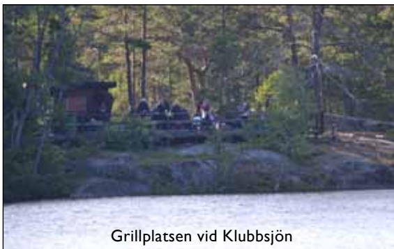
Grillplatsen vid Klubbsjön

Jag har varit med IF Rycket på olika utflykter i sommar. Första stället var vid Klubbsjön där vi åt en sallad och njöt av naturen. Nästa mål var Skuleberget där vi tog linbanan till toppen, tittade på den fina utsikten och åt våfflor i toppstugan. Var även på en tur till Rotsidan och vandrade runt i den vackra naturen, hade med egen pastasallad och fika. Har haft en mycket trevlig sommar fylld med äventyr.