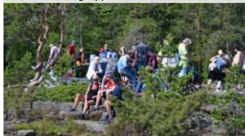
Vårn grupp vid Rotsidan

Jag har varit till Mariehamn, Åland, där jag såg en jättestor lyxbåt. I Mariehamn besökte jag också vackra St: Görans kyrka. I Vaxholm som ligger i Stockholms vackra skärgård besökte jag också en vacker kyrka samt fästningen. Har också kört gokart i Stockholm. Det var skitkul och läskigt!