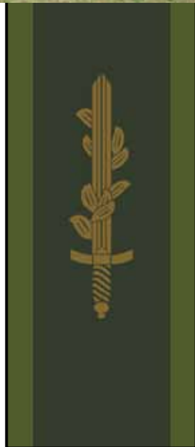
Detta märke har fältartisterna på axlarna på sin uniform.