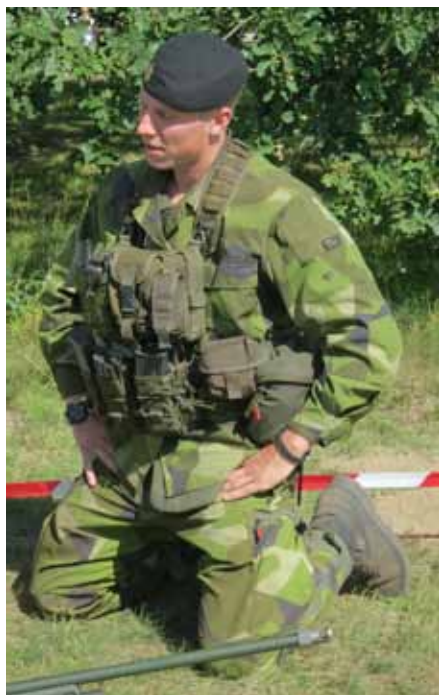
Fältuniform 90 (personen på bilden är soldat, inte fältartist)