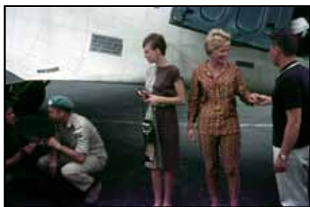
Försvarets underhållningsdetalj anländer till FN-styrkorna i Kongo 1962.