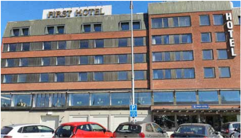
First Hotel är Statt i Härnösand