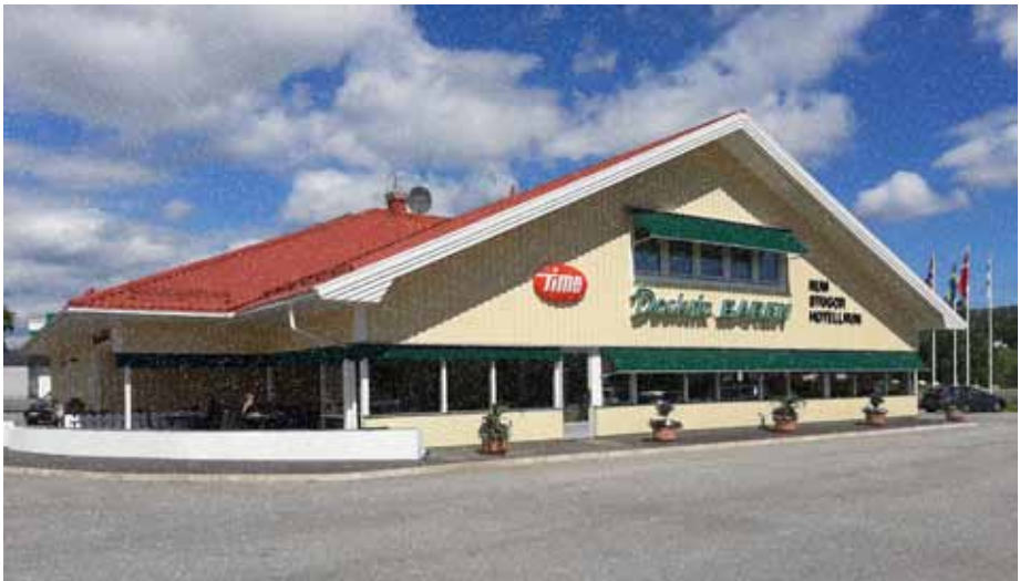
Dockstabaren är tradarfiket i Docksta