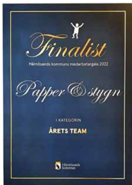
Det här fina diplommet står i matsalen.

Tyvärr blev det ingen seger den här gången.