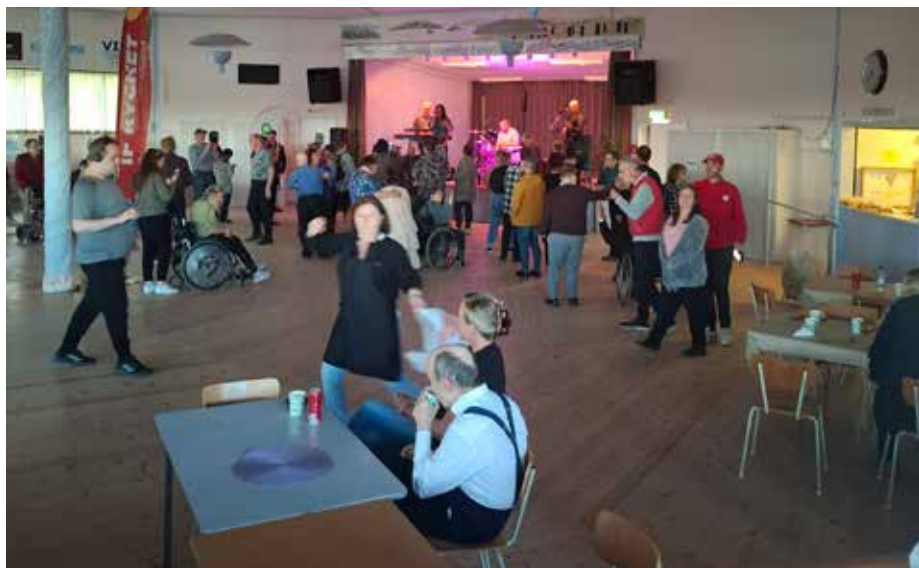
Länsdans Ramviks Folkets hus, 28 september 2024