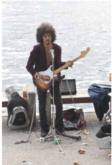
Högerhänta Jimi Hendrix med en gitarr strängad för vänsterhänta.

Vanligt är att det används för att passa en sångares röstomfång när en viss låt ska spelas och/eller för att skapa ett bredare och djupare ljud vid inspelning när gitarrerna ska spelas in igen.