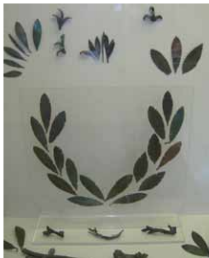
Museum för historien om de antika olympiska spelen; Olympia, Grekland.

Spelen avslutades den 5:e dagen då man hade en allmän festdag med prisutdelning, offer och banketter. Som pris i de olympiska tävlingarna fick segrarna officiellt bara en lagerkrans av olivblad från ett heligt olivträd som var helgat åt Zeus.