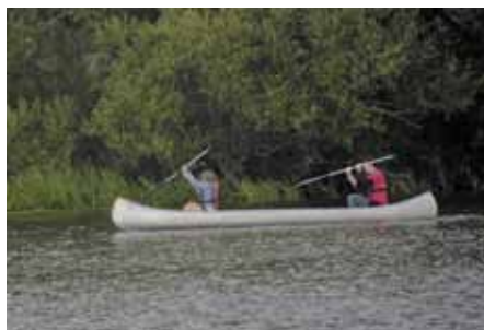
Det engelska namnet på kanotypen kanadensare är canadian canoe, kanadensisk kanot.